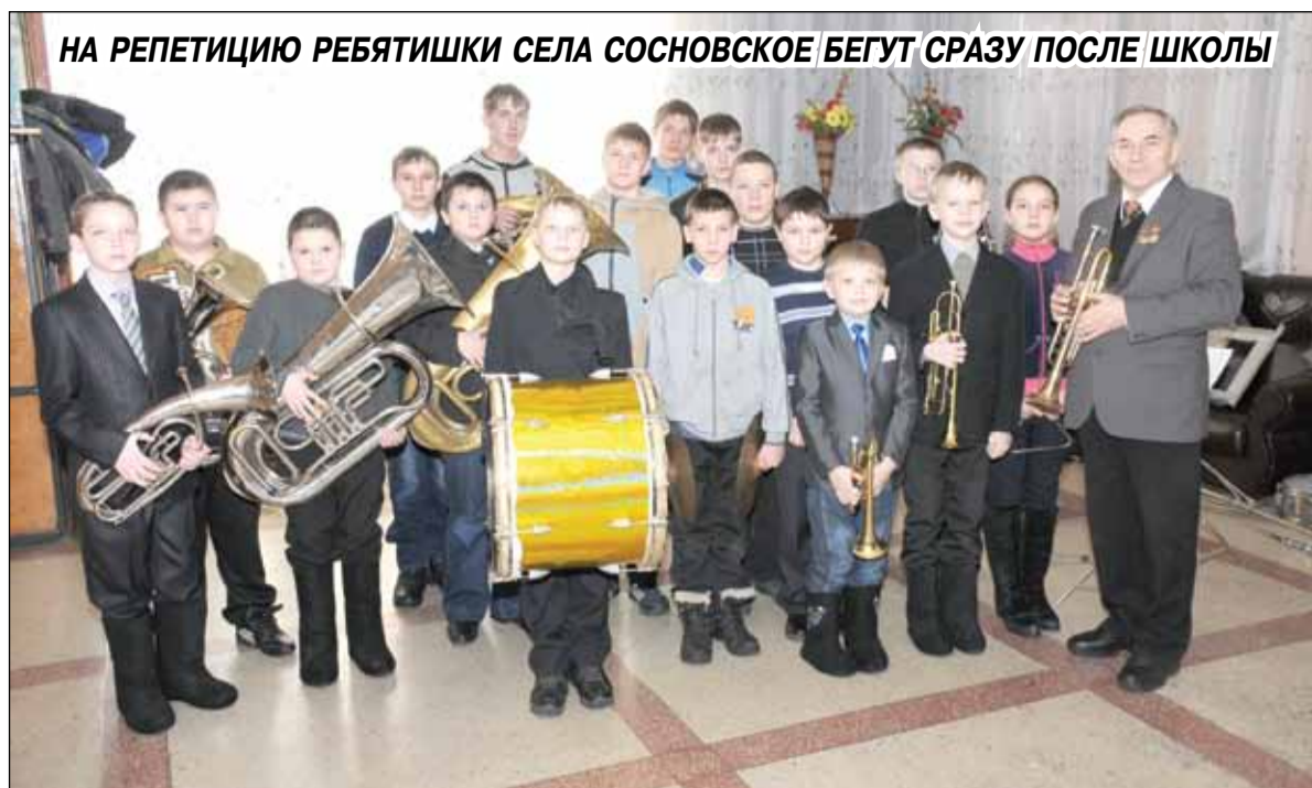
НА РЕПЕТИЦИЮ РЕБЯТИШКИ СЕЛА СОСНОВСКОЕ БЕГУТ СРАЗУ ПОСЛЕ ШКОЛЫ