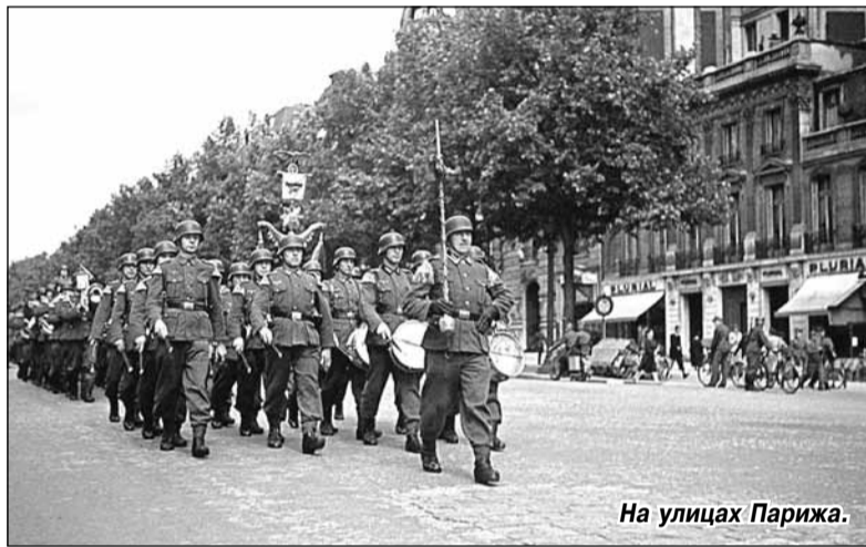
На улицах Парижа.

Но объективно говоря, совершенно ничтожным, при значительном населении, было движение Сопротивления Франции. Так, по данным тщательного исследования Бориса Урланиса о людских потерях в войнах (« Войны и народонаселение Европы »), в движении Сопротивления за пять лет погибли 20 тысяч французов (из 40-миллионного населения Франции). Притом за этот же период погибло от 40 до 50 тысяч французов, которые воевали за Третий рейх то есть в 2-2,5 раза больше! При этом частенько действия французского Сопротивления описываются так, что кажется, что оно сопоставимо с битвой за Ста-