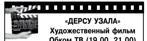
«ДЕРСУ УЗАЛА» Художественный фильм Обком ТВ (19.00, 21.00)

05.00 Мультфильмы. 05.45 «На золотом крыльце сидели...». Х/ф. 07.15 «Папа сможет?» (6+) 08.00, 12.00, 17.00 «Новости дня». 08.15 «Легенды космоса». (6+) 08.45 «Легенды цирка» с Эдгардом Запашным. (6+) 09.15 «Последний день». (12+) 10.00 «Не факт!». (6+) 10.40, 12.15 «Пассажир с «Экватора». Х/ф. (6+) 12.40 «Колье Шарлотты». Т/с. 17.20 «Процесс». Ток-шоу. (12+) 18.15 «Екатерина Воронина». Х/ф. (12+) 20.10 «Клуб самоубийц, или Приключения титулованной особы». Х/ф. 00.20 «Чистыми руками». Х/ф. (12+) 02.05 «Последний патрон». Х/ф. (12+)