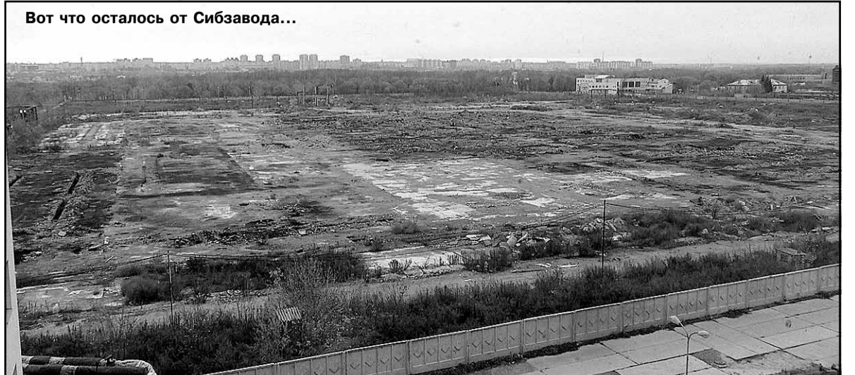
Вот что осталось от Сибзавода...